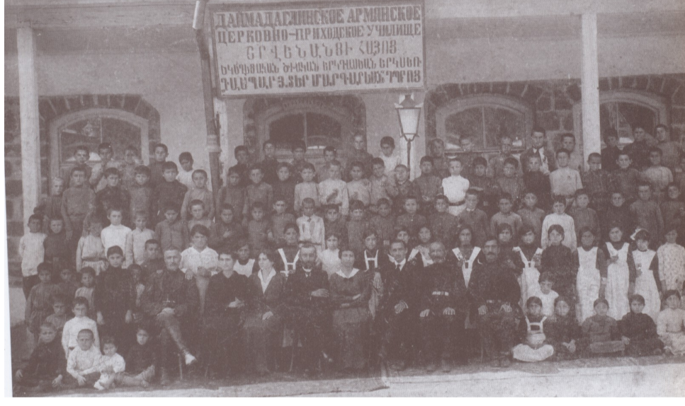
Շրվենանցի դպրոցի ուսուցչական եւ աշակարհական կուլեկտիվը, 1911թ.

Բեխ գյուղի անցյալի ու ներկայի մասին չափազանց հետաքրքիր ու տխուր տեղեկություններ ենք հանդիպում Ստեփան Մելիք Փարսադանյանի հրապարակումներում: Բեխը գտնվում է պատմական Հալիծորի բերդի արևելյան մասում, Չավնդուր գետի աջ ափին: Այս գյուղի անցյալում կային շատ մխիթարական երեւույթներ. Եթե հիշելու լինեցե՞ր Դավիթ բեկին օգնություն ձեռք մեկնող Մ. Փարսադանյանի եւ նրա փեսա Ավետիքի փայլուն գործունեությունը: Սակայն լրագիրը շեշտում էր, որ իրենց նպատակը գյուղի անցյալ փառքն ու գովքն անելը չէ, այլ փրկել կորցրածը: Ժամանակն արել էր իր գործը վճարելով գյուղի վարկը: Շրջանի առաջնակարգ գյուղերից մեկն էր համարվում Բեխը՝ թե տնտեսական-նյութական ապահովության եւ թե լուսավորության առումով: Ապահովության ամենազլխավոր հիմնաքարն է եղել Հալիծորի հանքը: Այդ հանքը, սակայն, կռվախնձոր էր դարձել բեկերի միջև: Այստեղ տիրում էր անհամերաշխ մթնոլորտ: Բեկերը կռվում էին հողի համար: Ամենուր տիրում էր անմիաբանություն եւ անհամերաշխություն: Իսկ հանքը նման մթնոլորտում չէր կարող բարգավաճել: Այս ամենի արդյունքն այն եղավ, որ գյուղից շատերը բռնեցին պանդխտության ճանապարհը, որովհետեւ հնարավորություն չուներ ուսում ստանալ իրենց գյուղում եւ չէին կարողանում առօրյա հացի համար գումար վաստակել: Նյութական տղություն պատճառով բեխցիներն ընդհատել էին իրենց ուսումը, խնդրում էին բարերարներին օգնության հասնել, սակայն, անօգուտ, նրանցից միայն մերժում էին ստանում: